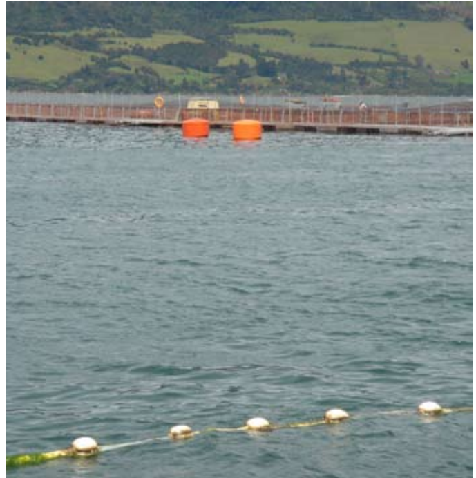
Balsa jaula ubicada en Cochamó, X Región.

Junto con esto, estas regulaciones controlaron el uso terapéutico de los antibióticos en acuicultura de manera drástica, a través de la vigilancia epidemiológica mantenida por las instituciones gubernamentales de salud pública, animal y humana (Wolf, 2004, Grave et al. , 1999 y Sorum, 2006).