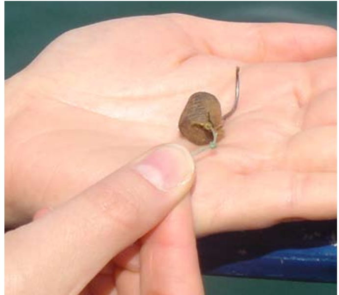
Pellets utilizado para pescar las especies que sirvieron para la investigación.

A la vez, fueron detectadas 87 partes por billón de oxitetraciclina en otra cabrilla que no contenía tabletas de alimento para salmón en su intestino.