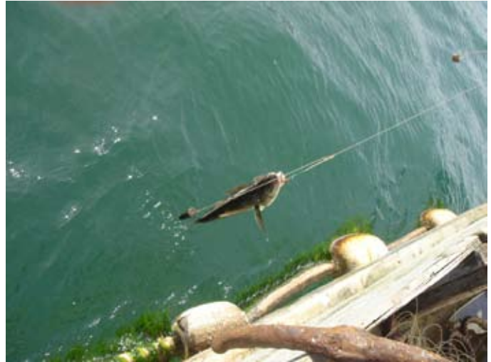
Pez capturado durante la investigación.

Por los potenciales problemas de salud humana y animal que la presencia de residuos de antibióticos en la carne de peces silvestres puede provocar y porque este fenómeno ha sido frecuentemente descrito (Bjorlund, 1990 y Samuelsen et al. , 1992), decidimos investigar en forma preliminar si peces silvestres de consumo humano que viven en el entorno de los recintos acuícolas presentan en su carne cantidades detectables de antibióticos.